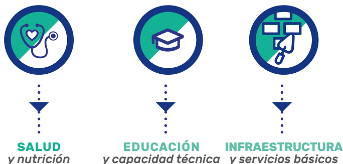
GRÁFICA 3. Pilares de actuación social

Los proyectos e inversiones de responsabilidad social que ejecutamos, responden a las necesidades de nuestras áreas de influencia, las cuales están alineadas a nuestro giro de negocio y se desarrollan con base en diferentes pilares de actuación: