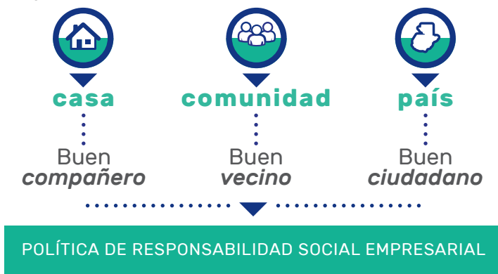
GRÁFICA 1. Objetivos de la Política de Responsabilidad Social Empresarial