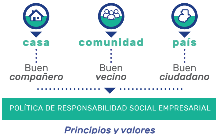
GRÁFICA 1. Objetivos de la Política de Responsabilidad Social Empresarial